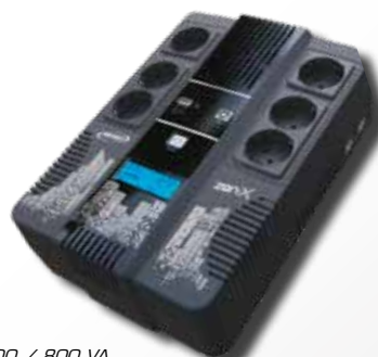
Zen-X 600 / 800 VA