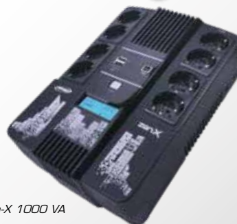
Zen-X 1000 VA